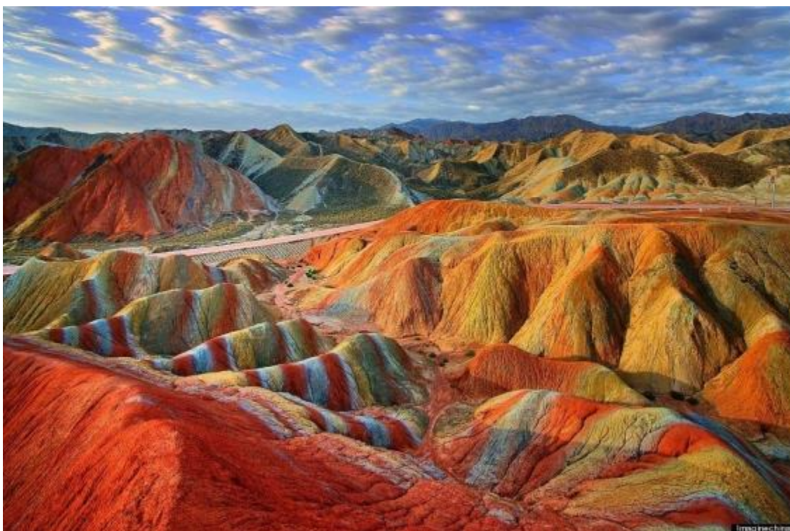
Las montañas de Zhangye Danxia, China (2020).

Montaña Kongtong: La montaña Kongtong es uno de los primeros lugares escénicos de nivel 5A en el país. También es un lugar escénico nacional clave, un parque geológico nacional y una reserva natural nacional. Ubicado a 11 kilómetros al oeste de la ciudad de Pingliang, tiene vistas a Xi'an al este, Lanzhou al oeste, Baoji al sur y Yinchuan al norte. Cabe destacar que posee la reputación de "Montaña" y "Maravillas de la ciudad del oeste" (Provincia de Gansu sitio web oficial, 2020).