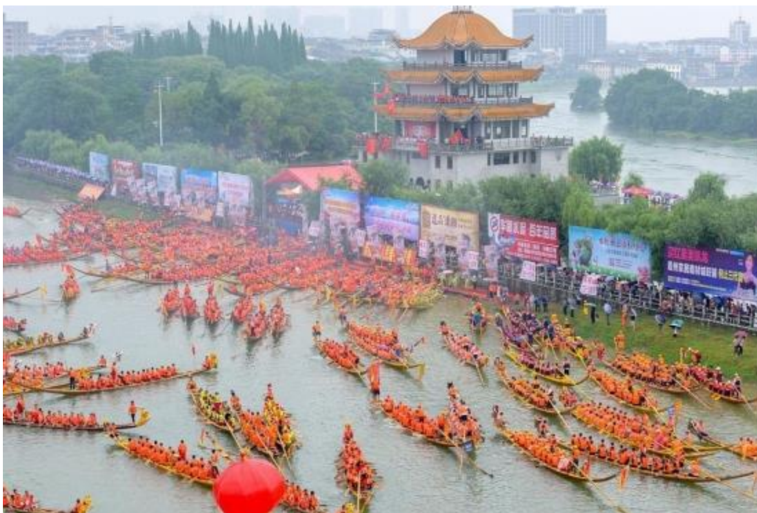
Vista Aérea del Festival del Bote del Dragón en la República Popular China (2020).

Fiesta de Duanwu o Festival del Bote del Dragón (端午节 Duānwǔjié): El quinto día festivo anual en China es el Festival del Bote del Dragón. Este día feriado cae en el quinto día del quinto mes del calendario chino, típicamente, en un día de junio del Calendario gregoriano. Con más de 2,000 años de historia, ésta es una de las fiestas chinas más tradicionales, y también una de las que involucra más supersticiones (迷信 míxìn).