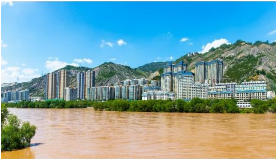
Fotografía de Lanzhou, capital de la Provincia de Gansu.