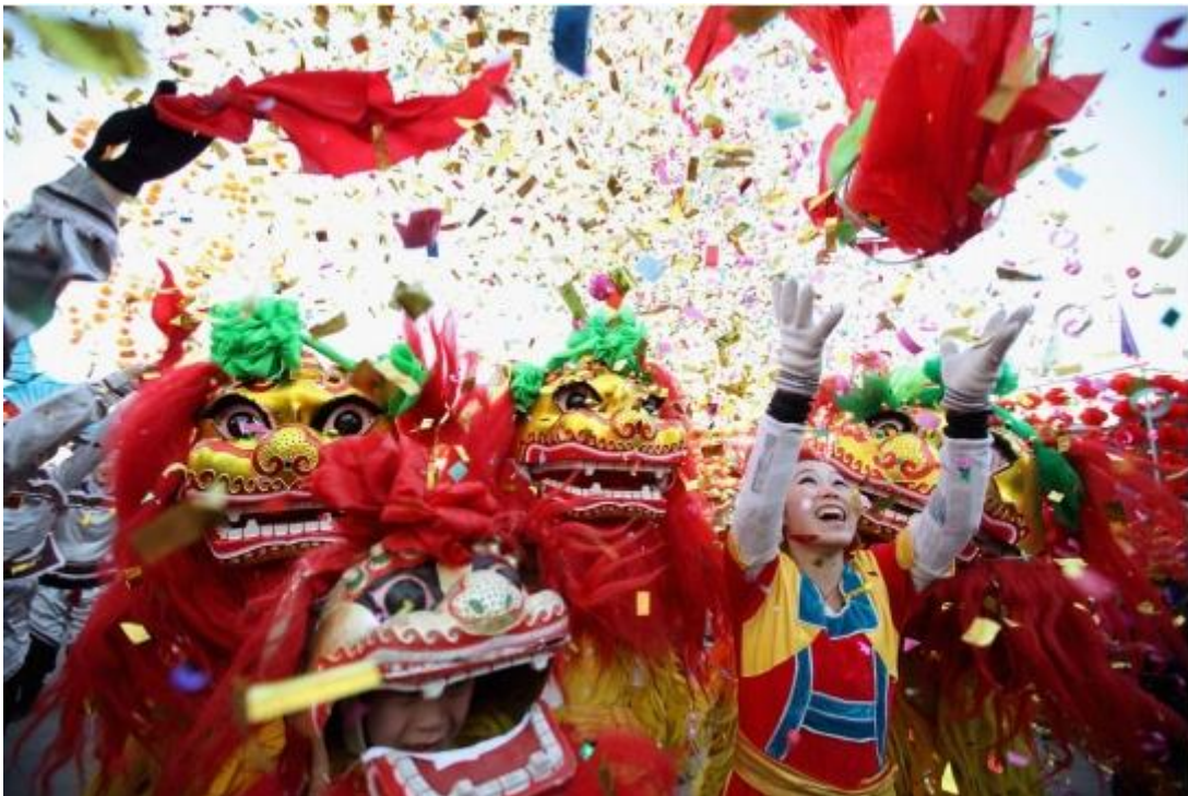
Fotografía de la Festividad de Año Nuevo Chino (2021).

Año Nuevo Chino (春节 Chūnjié): El segundo día festivo importante de cada año es el Año Nuevo Chino, también conocido como el Festival de Primavera. Esta fiesta es la más importante de todas las festividades chinas. Dado que se basa en el Calendario lunisolar chino, la fecha varía de un año a otro, pero generalmente se celebra a finales de enero o a principios de febrero.