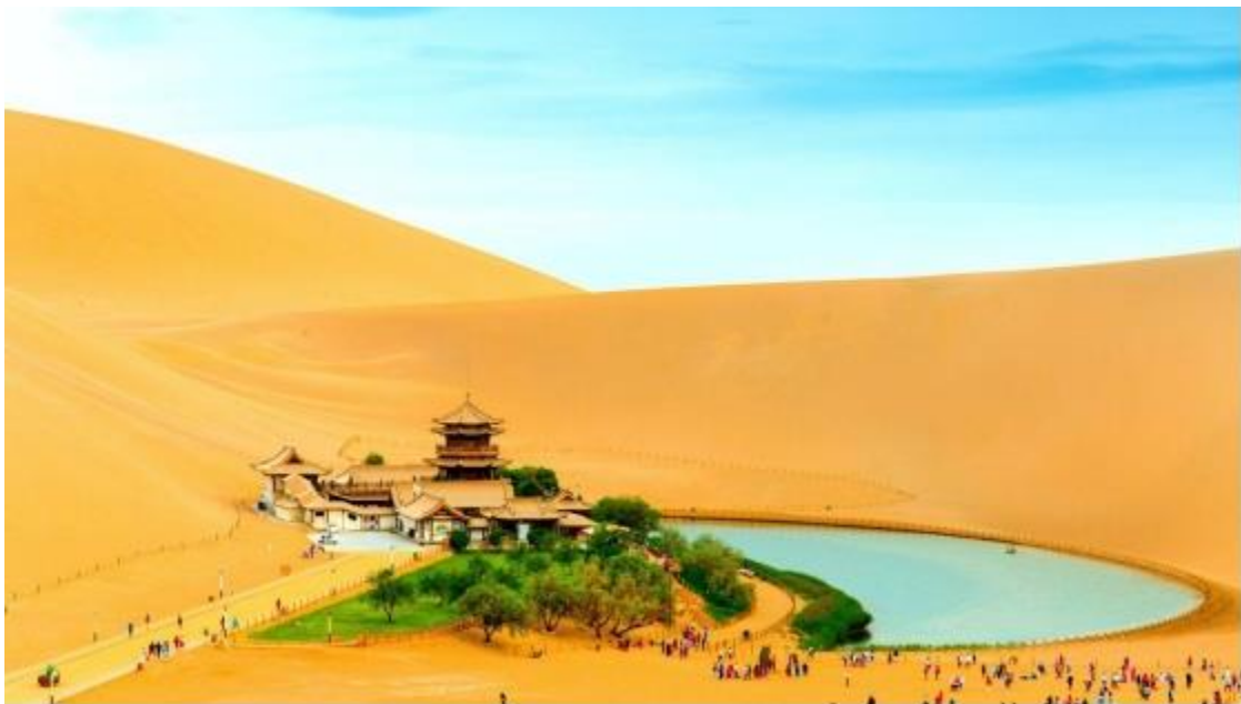
Vista aérea de la ciudad de Dunhuang, China (2020).

Ciudad de Dunhuang: La ciudad de Dunhuang está ubicada en el extremo más occidental del Corredor Hexi en la provincia de Gansu, en la intersección de Gansu, Qinghai y Xinjiang. Es el oasis más grande en los tramos inferiores del río Dang y el río Shule. Vale la pena señalar que es la puerta de entrada principal para que la "Ruta de la Seda" vaya hacia el oeste desde el paso de Yumen y el paso de Yang (Provincia de Gansu sitio web oficial, 2021).