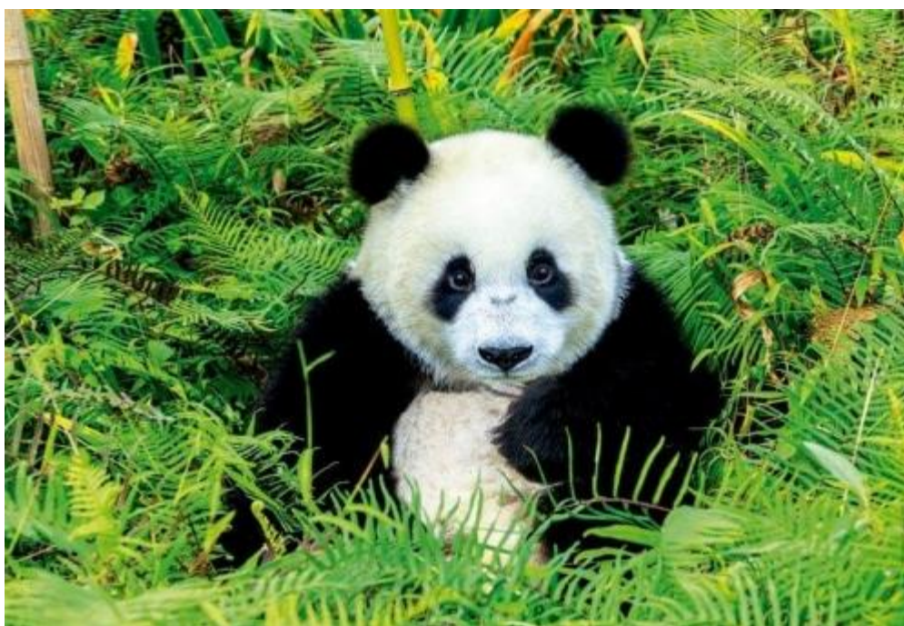
El Oso Panda (Ailuropoda melanoleuca), especie autóctona de dicha región.

En lo que respecta a la vida animal, Gansu tiene 659 especies de animales silvestres y 441 variedades de aves. Entre las 32 especies de animales exóticos y raros bajo protección estatal de primera clase se incluyen el panda, el mono de pelaje dorado, el antílope, el leopardo de nieve, el ciervo, la gamuza, marmotas, ciervos, zorros, el almizclero y el camello (Britannica, 2021).